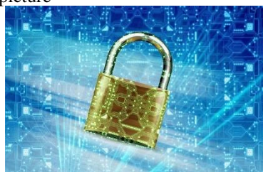
Figure 1. The exemplary title of the picture